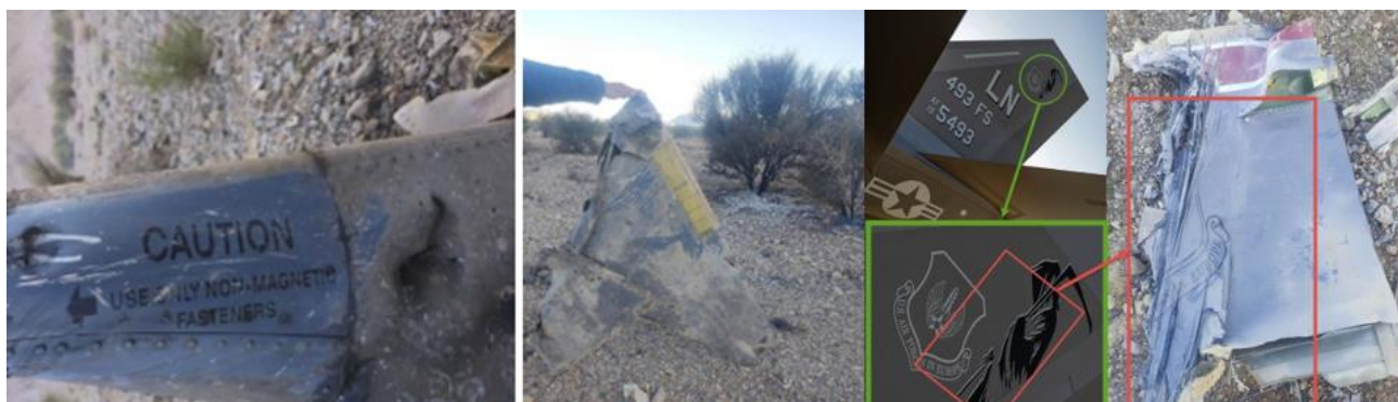
مرکزی ایران منتشر گردید :

در پاسخ به تکذیب سنتکام درباره انهدام جنگنده توسط ایران، تصاویری از انهدام جنگنده رادارگریز اف 35 در آسمان