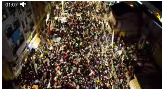
تبریز : تجمعات مردمی پرشور و فعال با حضور نوجوانان به عنوان آینده سازان کشور