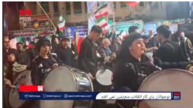
بخش دیپلماسی عمومی سفارت جمهوری اسلامی ایران در فرانسه