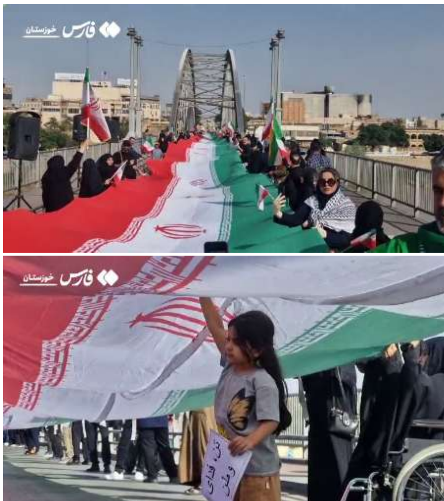
تشکیل زنجیره انسانی روی پل سفید اهواز به دنبال تهدیدات ترامپ مبنی بر هدف قرار دادن پل ها و زیرساخت های ایران